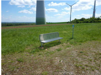
Eine Bank im 1. Wegabschnitt