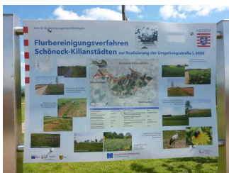
Info-Tafel zum Thema Flurbereinigung