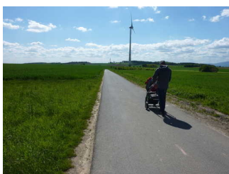
3. Abschnitt mit leichtem Gefälle