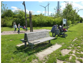
Nest-Schaukel und Bänke davor