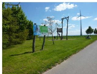
Info-Tafel im Gras neben dem Weg