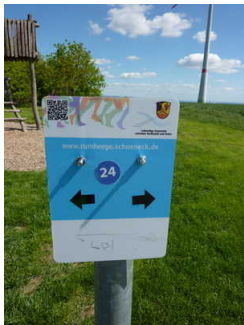
Schild mit blauem Kreis mit der weißen "24" zur Orientierung auf dem Weg.