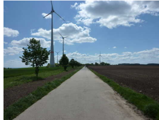
Der Wanderweg im 1. Wegabschnitt