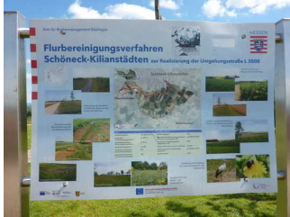
Info-Tafel zum Thema Flurbereinigung