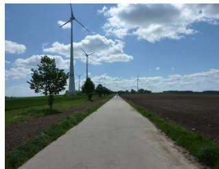
Der Wanderweg im 1. Wegabschnitt