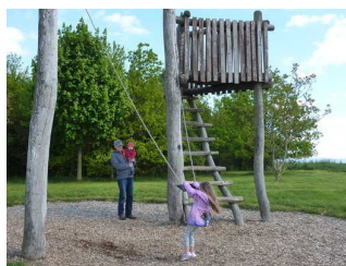
Himmelsschaukel und Aussichtsturm