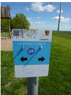
Schild mit blauem Kreis mit der weißen "24" zur Orientierung auf dem Weg.