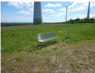
Eine Bank im 1. Wegabschnitt