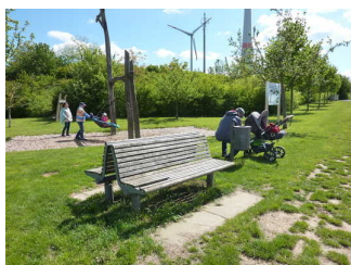
Nest-Schaukel und Bänke davor