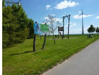
Info-Tafel im Gras neben dem Weg