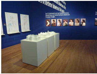
Ausstellungsraum im Haupthaus - EG