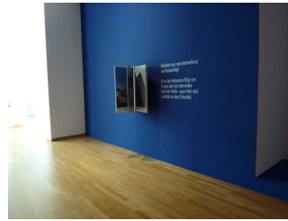
Ausstellungsraum im Haupthaus - EG