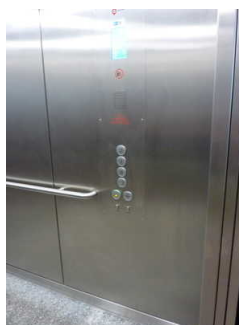
Aufzug zu allen Stockwerken im Haupthaus