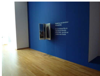
Ausstellungsraum im Haupthaus - EG