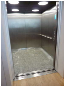
Aufzug zu allen Stockwerken im Haupthaus