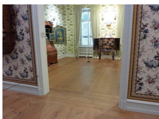
Ausstellungsräume in der Villa Metzler