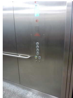
Aufzug zu allen Stockwerken im Haupthaus