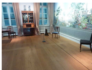
Ausstellungsräume in der Villa Metzler