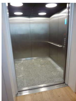
Aufzug zu allen Stockwerken im Haupthaus