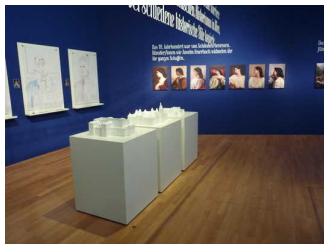
Ausstellungsraum im Haupthaus - EG