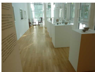
Ausstellungsraum im Haupthaus - EG