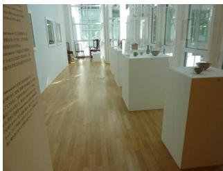
Ausstellungsraum im Haupthaus - EG