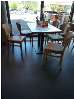
Unterfahrbare Tische der Seilbar