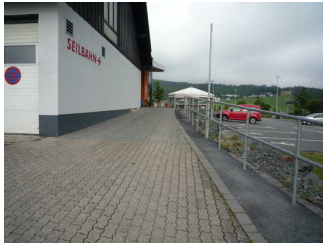
Weg von Parkplatz zur Kasse