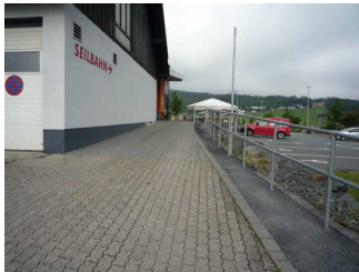
Weg von Parkplatz zur Kasse