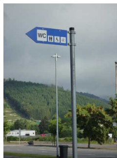
Beschilderung Seilbahn (2)

Es sind keine Informationen vorhanden, die der Orientierung dienen und aus Wörtern bestehen.