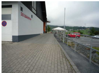
Beschilderung Seilbahn (1)