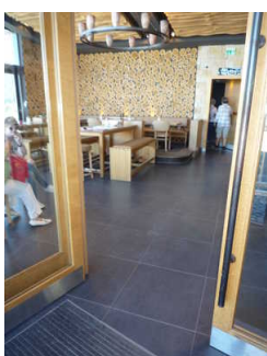
Durchgangstür zum Gastraum der Seilbar