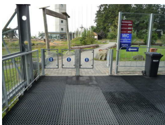
Weg von Bergstation zum Hochheideturm