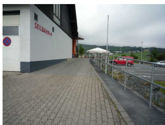
Weg von Parkplatz zur Kasse