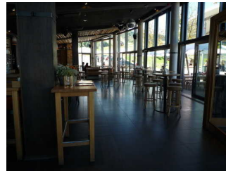
Gastraum der Seilbar