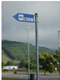
Beschilderung Seilbahn (2)

Es sind keine Informationen vorhanden, die der Orientierung dienen und aus Wörtern bestehen.