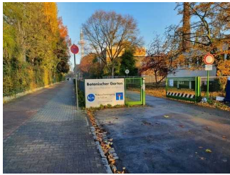
Weg vor dem Eingangstor