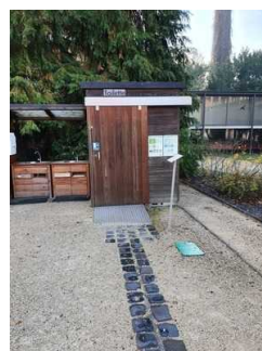
Weg vom Hauptweg zum WC