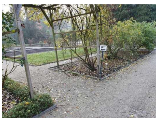
Weg vom Hauptweg zum WC