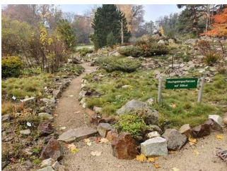
Kleinere Wege im Garten