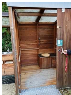
Tür zum WC für Menschen mit Behinderung