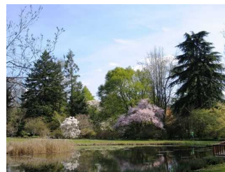
Stadt Frankfurt am Main/ Botanischer Garten