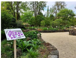
Stadt Frankfurt am Main/ Botanischer Garten