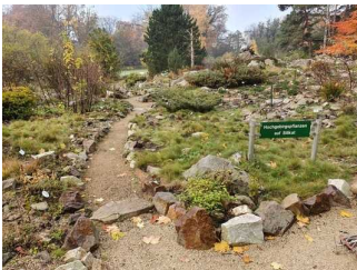
Kleinere Wege im Garten