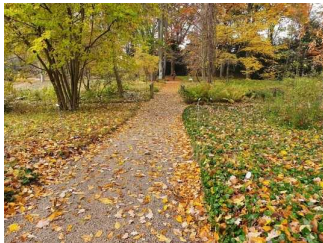
Hauptwege im Garten