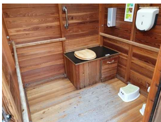
WC für Menschen mit Behinderung