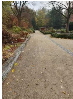
Hauptwege im Garten