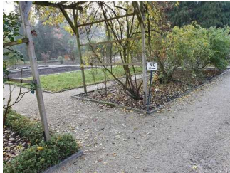
Weg vom Hauptweg zum WC