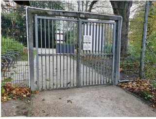
Eingangsbereich am Grüneburgpark