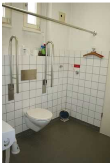
WC für Menschen mit Behinderung im Museum