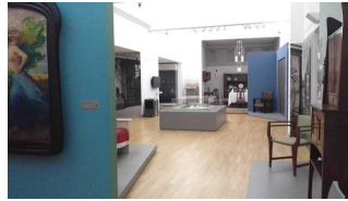
Ausstellungsraum 3 (links vom Foyer)