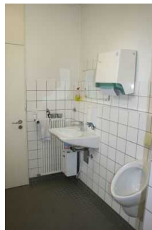
WC für Menschen mit Behinderung im Museum