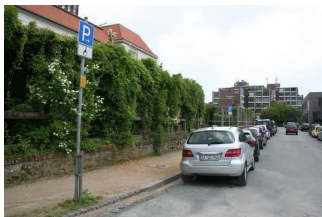
Behindertenparkplatz am Olbrichweg