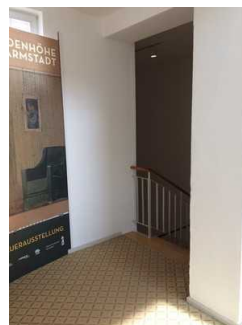
Weg vom Haupteingang zur Treppe ins UG