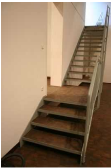
Treppe in Ausstellungsraum 2 im UG