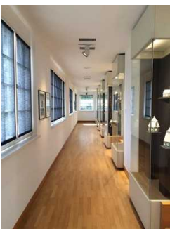
Nebenraum zu Ausstellungsraum 2 bzw. 3