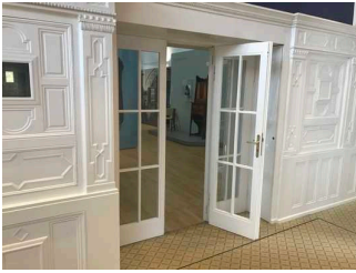
Ausstellungsraum 3 (links vom Foyer)