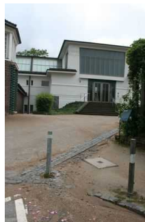
Weg vom Parkplatz zum Museum