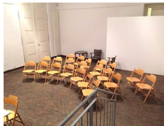
Ausstellungsraum 2 im UG