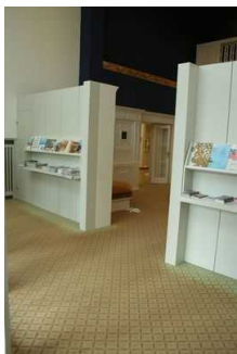
Weg vom Kassenbereich zum Ausstellungsbereich