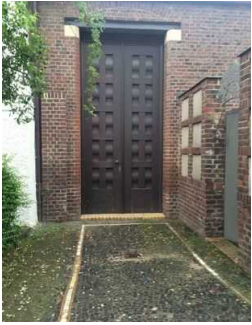
Nebeneingang Museum UG