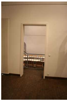
Ausstellungsraum 2 im UG