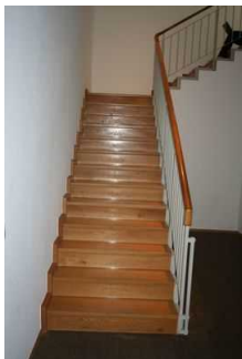
Treppe vom Museum ins UG