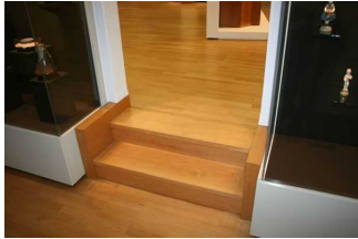
Treppe von Ausstellungsraum zum Nebenraum