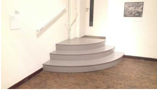
Treppe in Ausstellungsraum 1 im UG