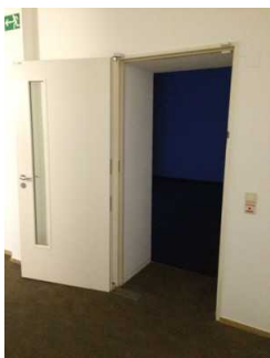
Ausstellungsraum 1 im UG