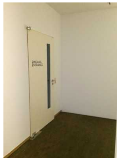
Ausstellungsraum 1 im UG