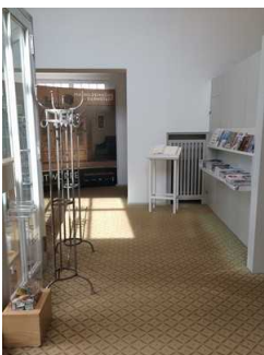
Weg vom Haupteingang zur Treppe ins UG