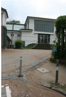
Weg vom Parkplatz zum Haupteingang Museum