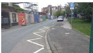
Behindertenparkplatz am Olbrichweg