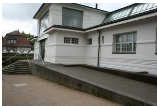
Rampe zum Haupteingang