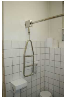
WC für Menschen mit Behinderung im Museum