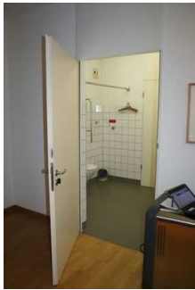
WC für Menschen mit Behinderung im Museum