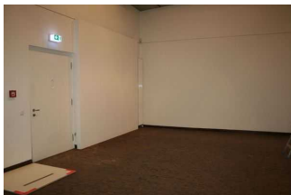
Ausstellungsraum 1 im UG