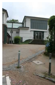
Weg vom Parkplatz zum Museum