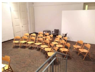
Ausstellungsraum 2 im UG