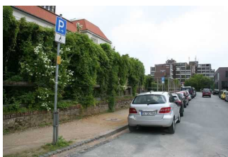
Behindertenparkplatz am Olbrichweg