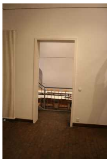
Ausstellungsraum 2 im UG