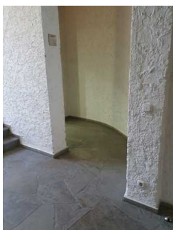
Flur zum Aufzug (EG und UG)