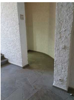
Flur zum Aufzug (EG und UG)