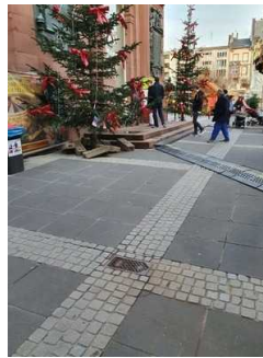
Weg vom Parkplatz zum Haupteingang