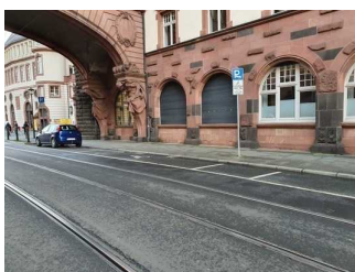
Parkplatz für Menschen mit Behinderung