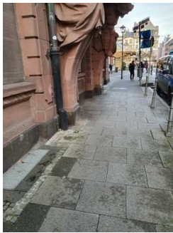
Weg vom Parkplatz zum Haupteingang