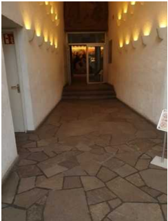
Flur zur Wandelhalle