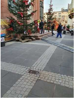
Weg vor dem Haupteingang