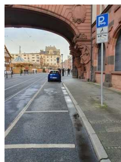
Parkplatz für Menschen mit Behinderung