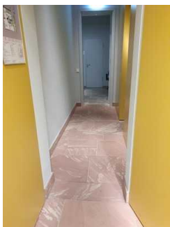
Flur vom Foyer zur Treppe (EG)