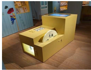
Struwelkosmos und Heinrich- Hoffmann-Raum (1. OG)