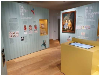
Struwelkosmos und Heinrich- Hoffmann-Raum (1. OG)