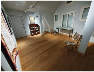
Galerie (3. OG)