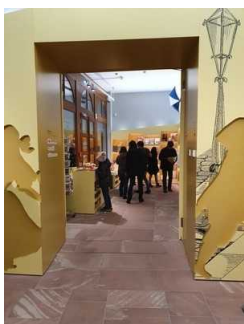
Durchgang vom Foyer zum Shop