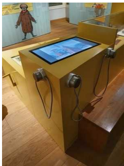
Struwelkosmos und Heinrich- Hoffmann-Raum (1. OG)