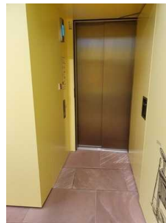
Bewegungsfläche vor dem Aufzug im EG