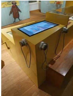
Struwwelkosmos und Heinrich- Hoffmann-Raum (1. OG)