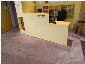
Museumskasse im Foyer