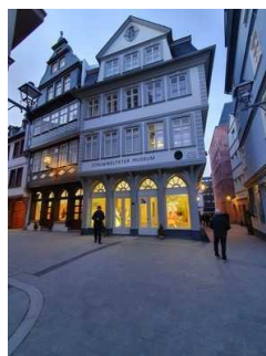
Weg vor dem Museum