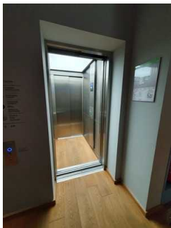
Aufzug vom EG zum 1. - 2. OG