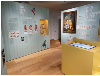
Struwwelkosmos und Heinrich- Hoffmann-Raum (1. OG)