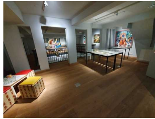
Galerie (3. OG)