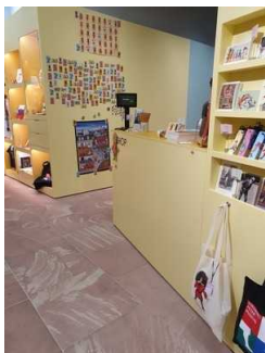
Kasse im Shop