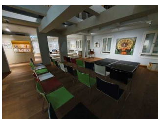
Struwelforum (2. OG)