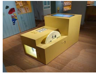
Struwwelkosmos und Heinrich- Hoffmann-Raum (1. OG)