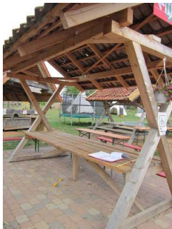
unterfahrbare Tisch im Außenbereich