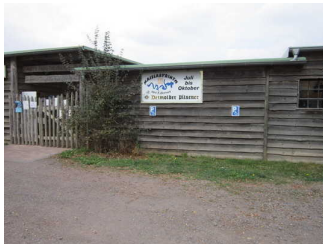
Behinderten- Parkplatz Maislabyrinth