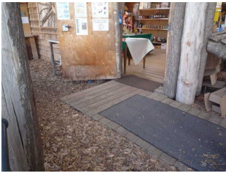
Blick in den Bauernladen