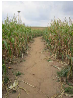
Weg durch das Maislabyrinth