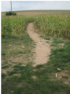
Weg durch das Maislabyrinth