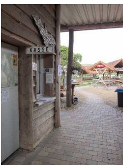
Weg zur Kasse