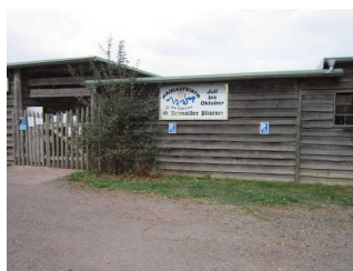
Haupteingang des Maislabyrinthes Edersee