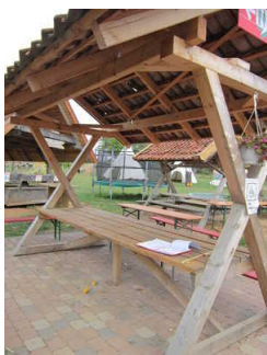
unterfahrbare Tisch im Außenbereich