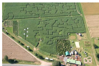
Luftbild des Maislabyrinthes Edersee