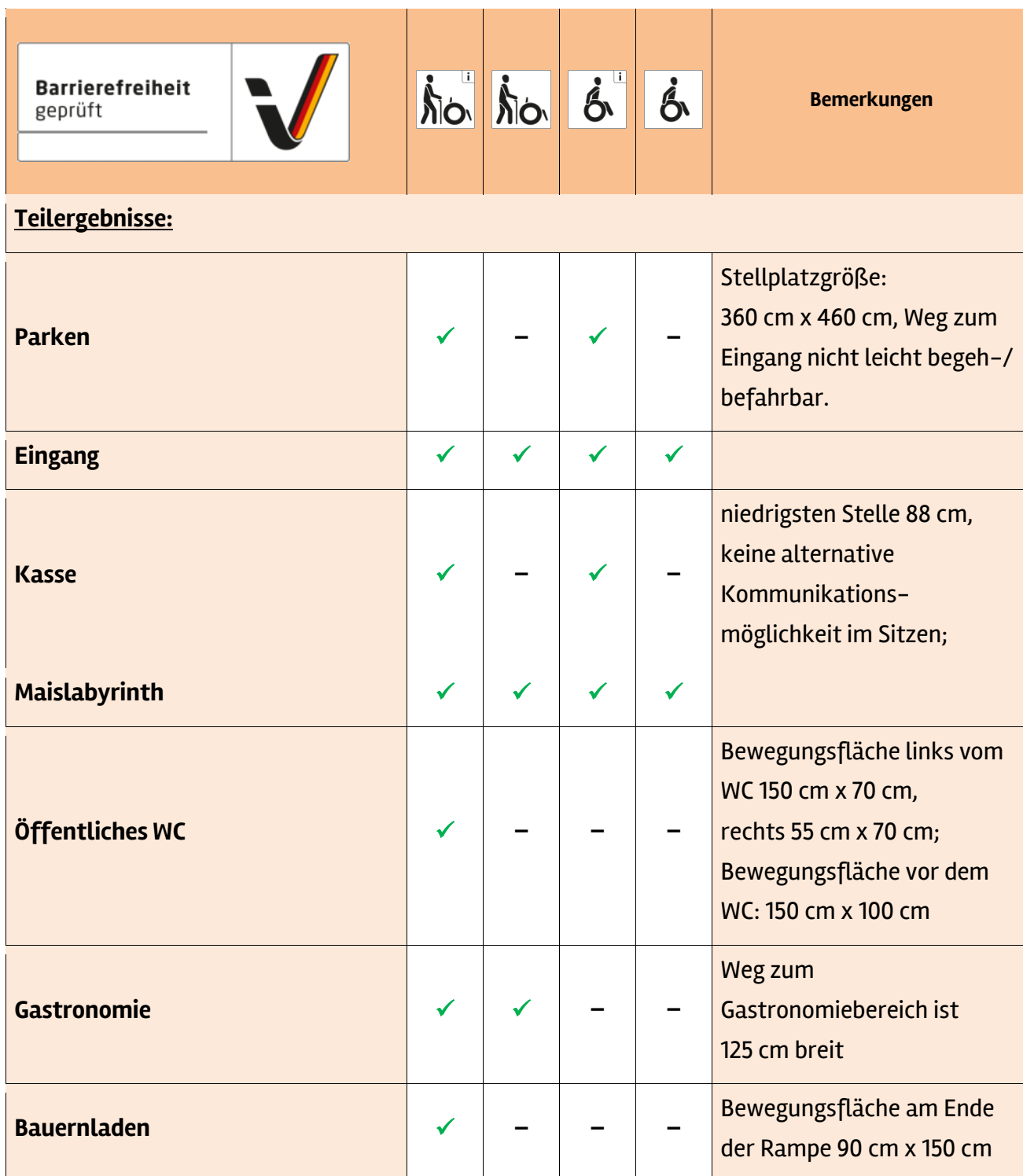
Tabelle 1: Überblick über das Prüfergebnis