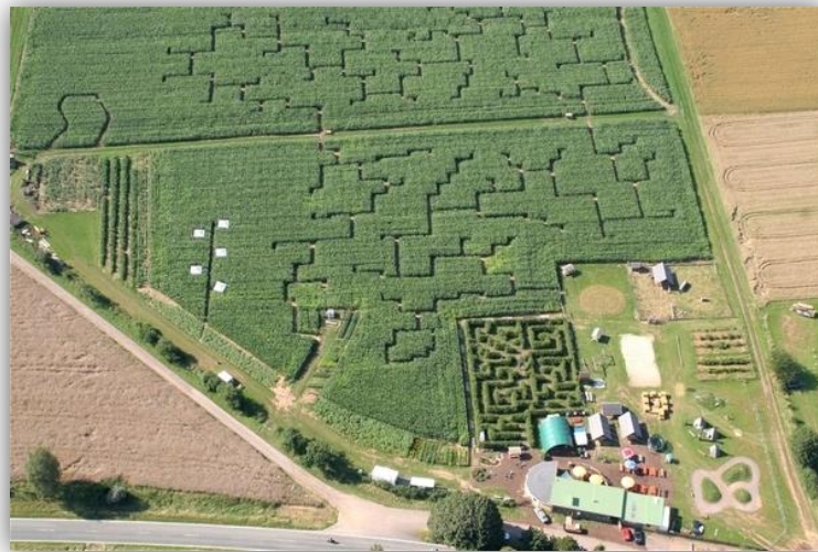
Maislabyrinth am Edersee