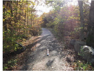
Einstieg Wanderweg Hagenstein