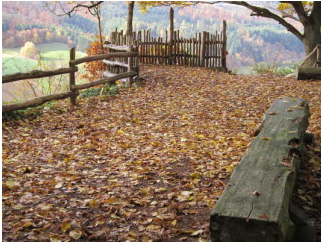
Aussichtspunkt Hagenstein mit Aussichtsplattform