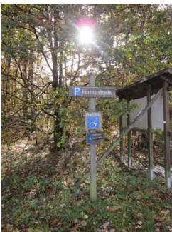
Behindertengerechter Parkplatz auf Wanderparkplatz Himmelsbreite