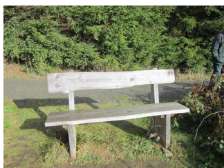
Sitzgelegenheit entlang des Weges