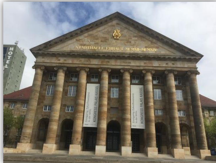
Kongress Palais Kassel