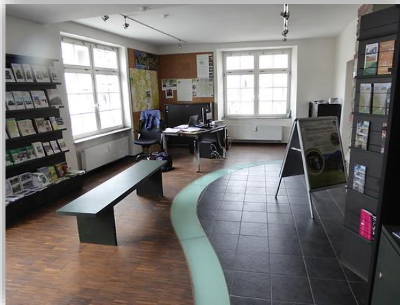
Tourist Information Zwingenberg