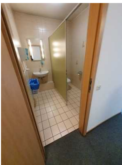
Öffentliche Toilette für Herren (1. OG)