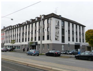
Außenansicht des Hotels