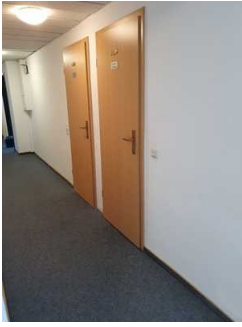
Türen zu den öffentlichen Toiletten (1. OG)