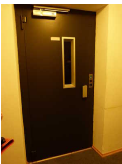
Aufzugstür im 1. OG