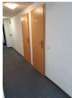
Türen zu den öffentlichen Toiletten (1. OG)