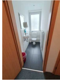
Öffentliches WC für Damen (1. OG)