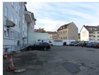
Gästeparkplatz hinter dem Haus