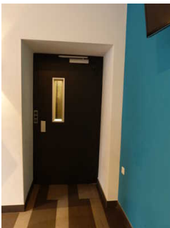
Aufzugstür im EG