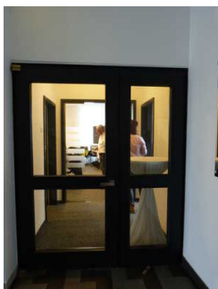
Vorraum im Tagungsbereich (EG)