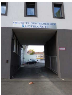
Gästeparkplatz hinter dem Haus