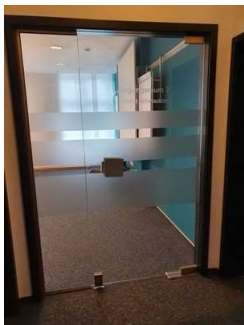
Tür zum Tagungsraum (EG) Tagungsraum (EG)