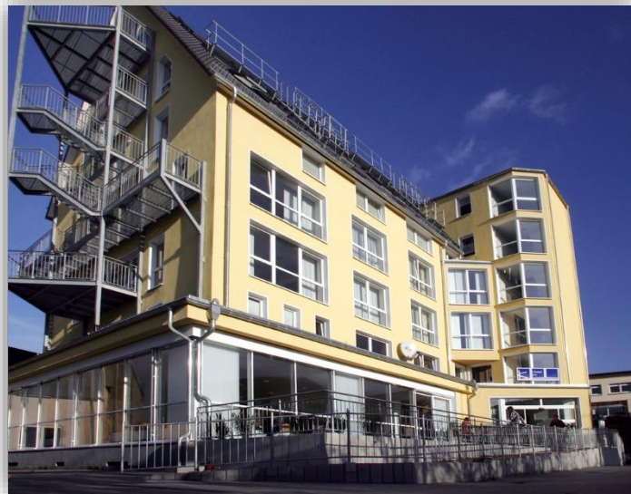
Hotel im Kornspeicher