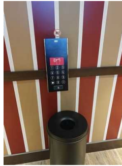
Bedientableau vor dem Aufzug