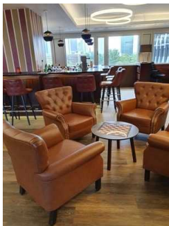
Lobby / Bar