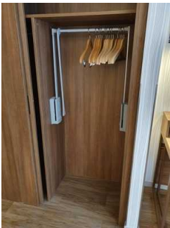
Kleiderschrank in Zimmer 411