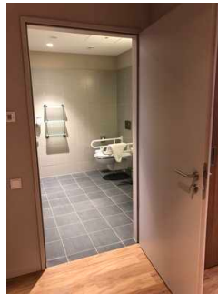
Tür zum Bad in Zimmer 421