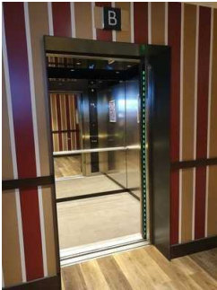
Zwei baugleiche Aufzüge zum Hotel