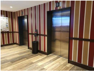
Zwei baugleiche Aufzüge zum Hotel