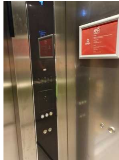
Bedientableau im Aufzug (Notruf)