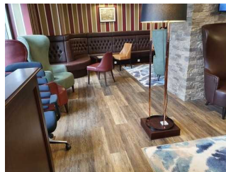
Lobby / Bar