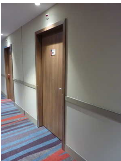
Tür zu Zimmer 411