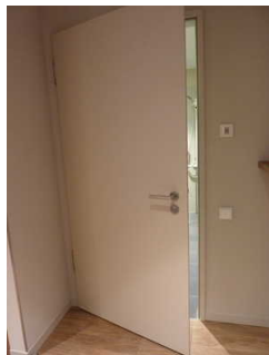
Tür zum Bad in Zimmer 411