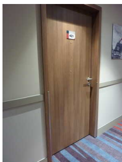
Tür zu Zimmer 421