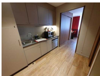
Kochnische in Zimmer 411