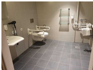
Bad in Zimmer 411