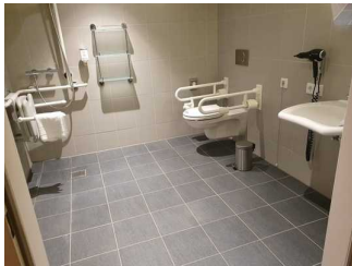
Bad in Zimmer 421