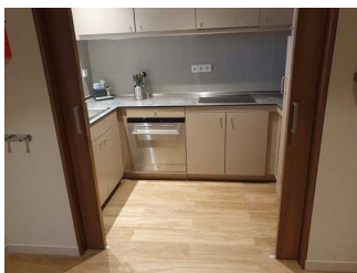
Kochnische in Zimmer 421