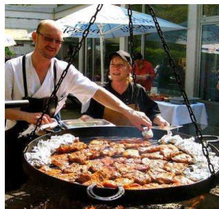
Kolping Feriendorf Herbstein

Kolpingferiendorf Herbstein gemeinnützige GmbH