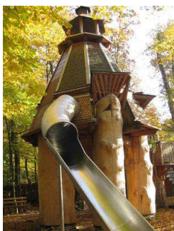
Kolping Feriendorf Herbstein

Kolpingferiendorf Herbstein gemeinnützige GmbH