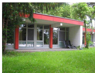
Kolping Feriendorf Herbstein

Kolpingferiendorf Herbstein gemeinnützige GmbH