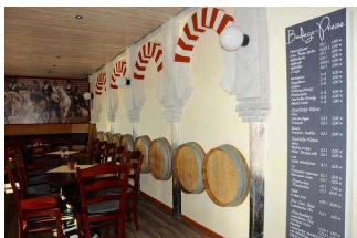
Kolping Feriendorf Herbstein

Kolpingferiendorf Herbstein gemeinnützige GmbH