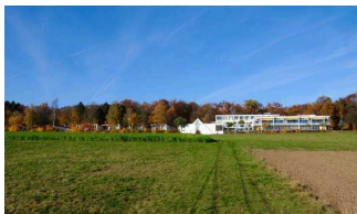
Kolping Feriendorf Herbstein

Kolpingferiendorf Herbstein gemeinnützige GmbH