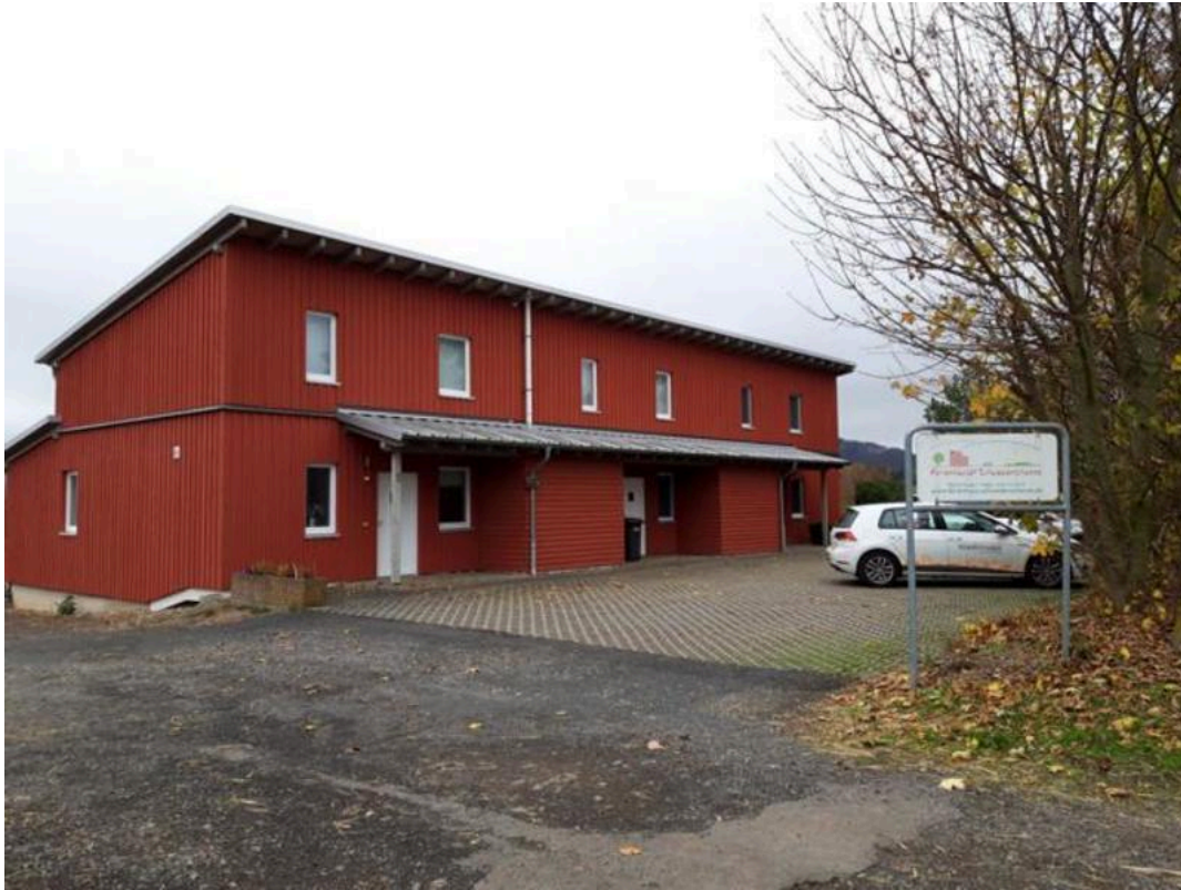
Ferienhäuser Schwedenschanze