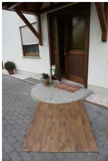
Stufe vor Eingangstür