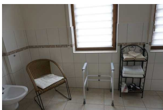
Badezimmer / Gehhilfe