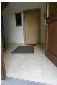
Gang von Eingangstür zur Wohnungstür